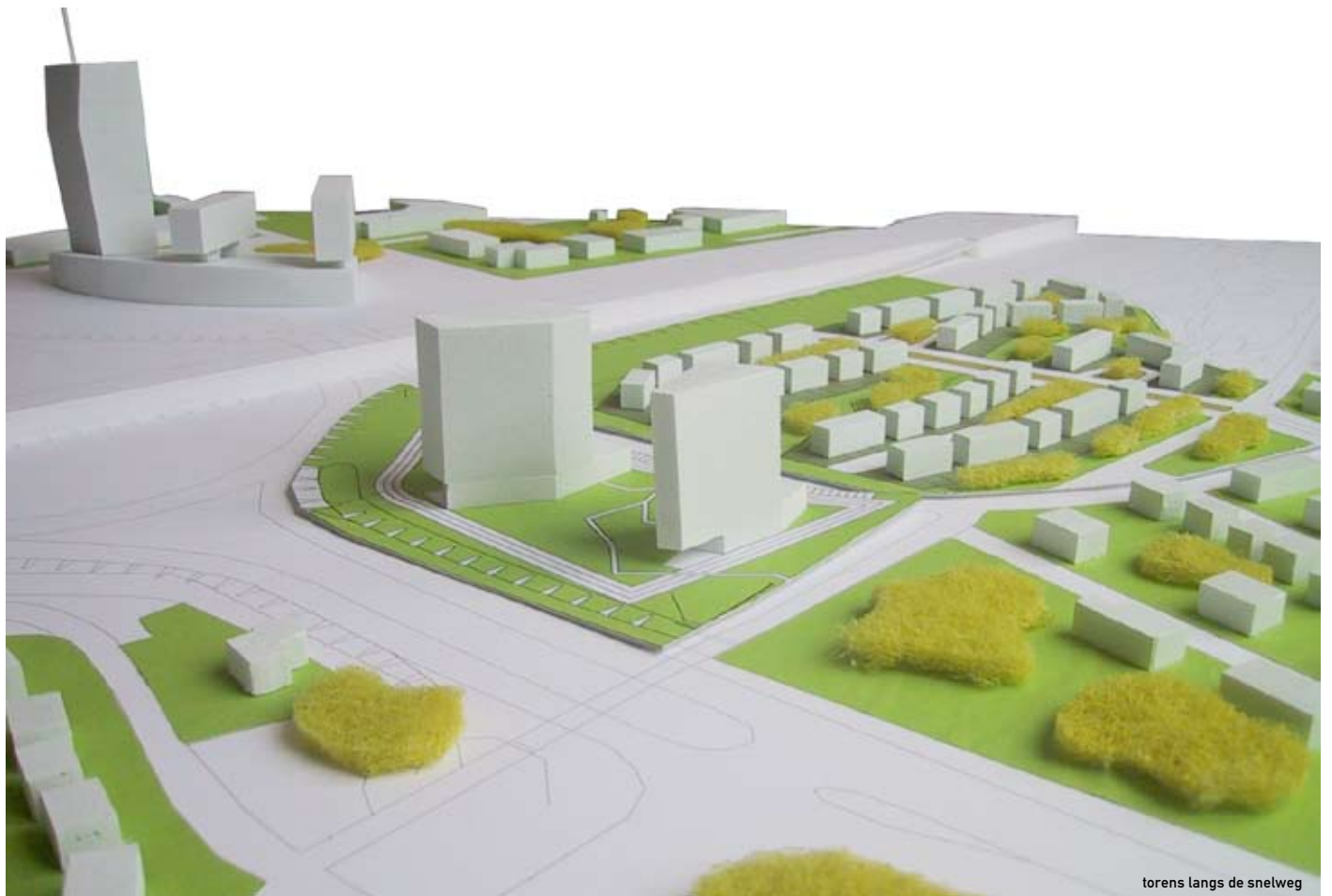
torens langs de snelweg