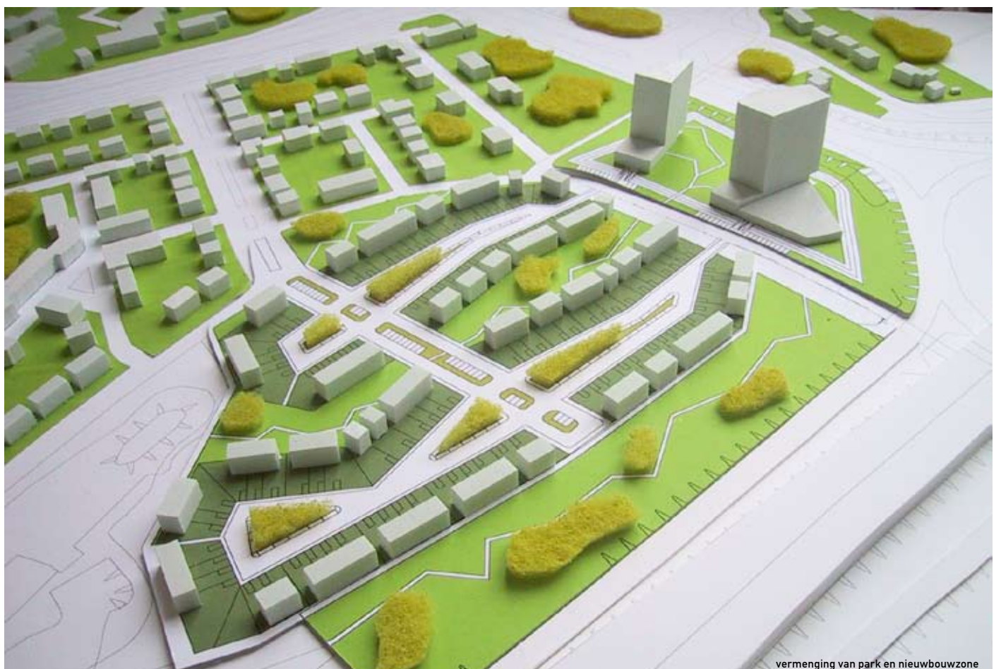
vermenging van park en nieuwbouwzone